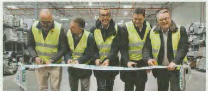
Die Salamander-Geschäftsführung bei der Eröffnung des neuen Logistikzentrums am Produktionsstandort im polnischen Wloclawek.

Türkheim. In neun Monaten Bauzeit hat die Salamander Industrie-Produkte GmbH an ihrem Produktionsstandort im polnischen Wloclawek ein neues Logistikzentrum inklusive Büroräumen sowie Lager- und Parkflächen errichtet. Der Neubau für Salamander Window & Door Systems umfasst rund 47.000 m 2 . Wloclawek ist neben dem Stammsitz in Türkheim der bedeutendste Produktionsstandort für Salamander mit rund 600 Mitarbeitenden. Mehr als 28 Millionen Euro wurden in die Erweiterung investiert. Großen Wert legte